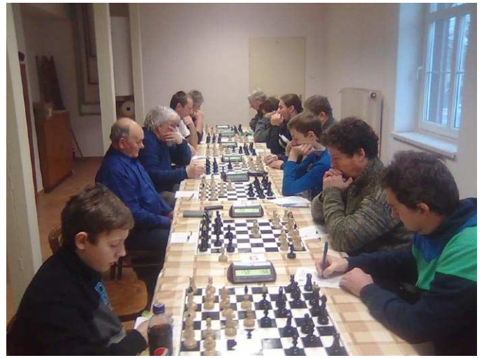
Kyjovská sokolovna v plném nasazení