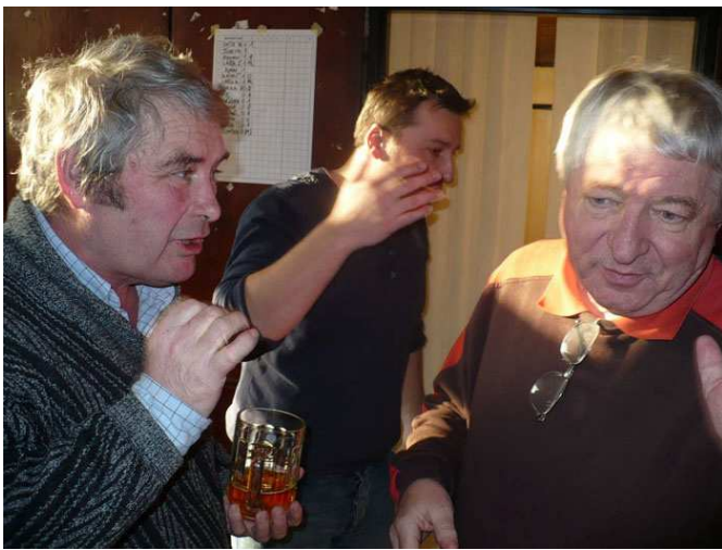
Foto zachycující rozhovor dvou zasloužilých členů BudChess klubu je zajímavé svou dynamikou