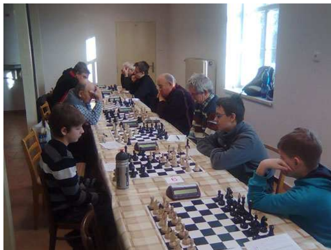
Poslední šachovnice na straně Kyjova zůstala sirá

13.den v kalendáři znamenal pro kyjovský tým největší prohru co pamatuji. Už příjezd Ždánských posíl, kdy z auta nevystoupil očekávaný Pavlík, který tentokrát po delší době prohrál svůj nekončící boj s vlastními démony, nevěstil nic dobrého.