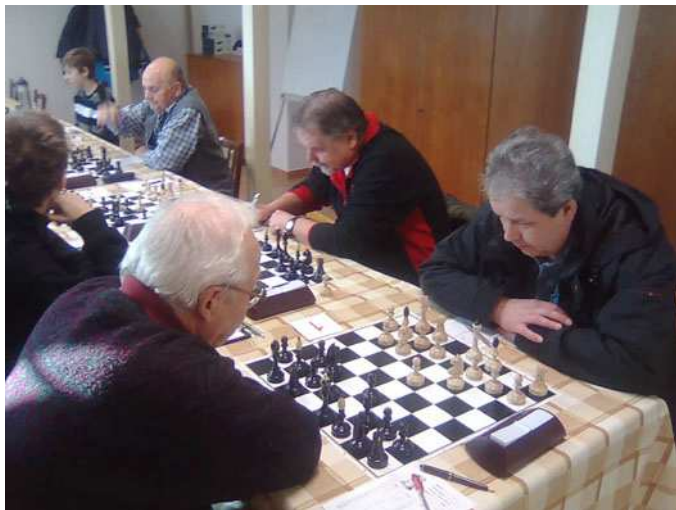
Půl bodu na první a šesté šachovnici se ukázaly být toho dne jediné