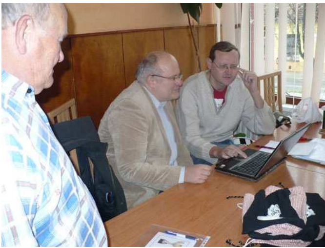
Technická příprava turnaje v rukou odborníků