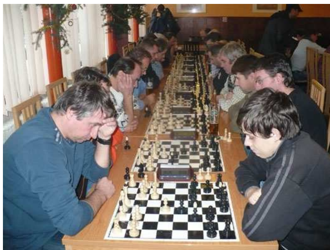
Pohled do saloonu ždánického hotelu Radlovec, kde proběhl závěr BudChess sezóny 2012