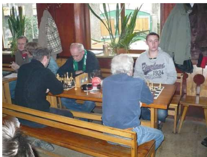
Uvolněná atmosféra 110. BudChess cupu

Sledujte naše stránky www.budchess.sweb.cz , kde naleznete krátce po každém turnaji kompletní výsledky.