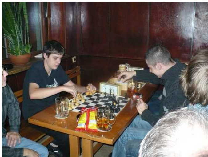
96. účastník turnajů BudChess série