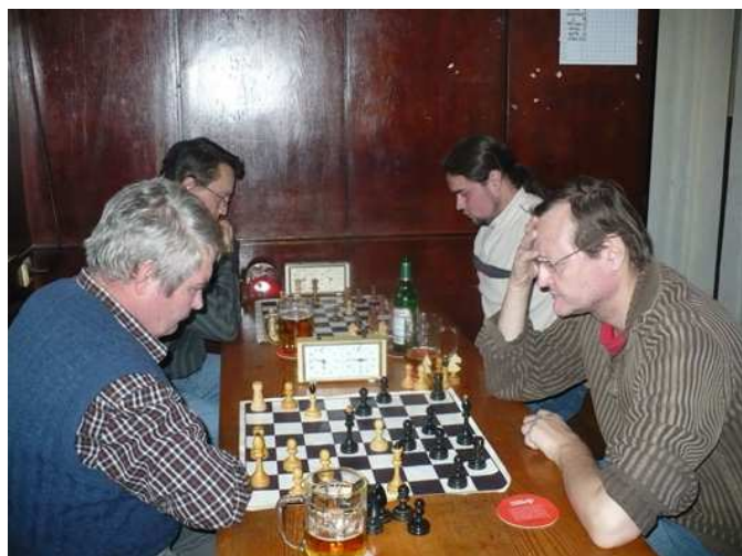
V 2.kole se utkali a smírně se rozešli tradiční soupeři kapitán našich krajských budšachistů a náš nenahraditelný ředitel Bud série.