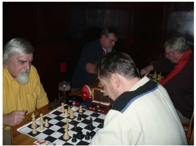
Soustředěné úsilí hráčů v klidné části šachového saloonu – za výčepem.