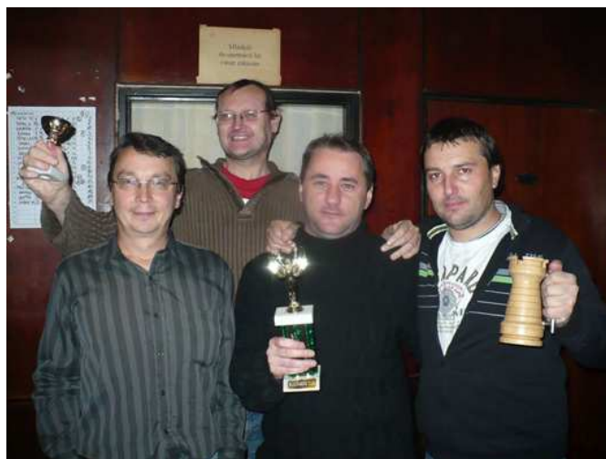
Nejlepší hráči 110. turnaje Bud série a jejich trofeje, které budou zdobit minimálně do svatého Štěpána jejich příbytky.