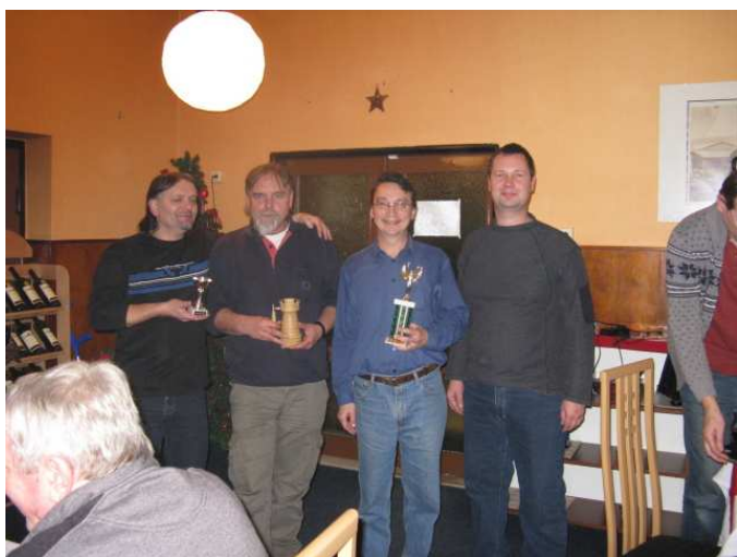
Nejlepší šachisté loňského Štěpánského turnaje ve Ždánicích