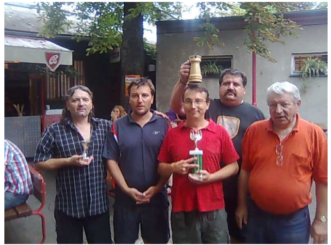
Medailisté srpnového BudChess cupu