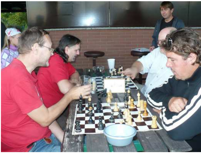
Momentka z turnaje v bleskové hře hraného po přesunu do Boršova

Důsledkem slabého nátisku hráčů (celkem padlo pouze 70 dávek B12) bylo, že přes veškerou snahu vynikající obsluhy našeho odborně vedeného bufetu, se nepodařilo dopít bečku podpůrného nápoje B12, takže zdravé jádro organizátorů se muselo i s zbývajícím proviantem přesunout k Bubinovi do Boršova, kde se musela bečka dopít. Těchto jedinců bylo celkem 7 (větší počet se přes lákadlo turnaje v bleskové hře započítávaného do BudChess série nepodařilo sehnat) a po posílení o trojici příchozích (Hubek, Veronika a Vítek) se dobrá věc podařila. V družné zábavě postupně B12 zmizel a podařilo se i sehrát turnaj a to přesto, že přestaly fungovat jedny ze dvou hodin, takže se musely bleskovky hrát i bez nich, což chtělo značnou ukázněnost hráčů. Turnaj vyhrál E. se 4b před Tondou s 3,5 b, Laďou, Punkvou (oba 2,5 b), Bubinem (2 b) a Vítkem s 0,5 b.