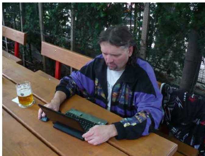
Náš redakční fotograf dal tentokrát přednost cyklistickým závodům. Na obrázku již po návrat z akce.