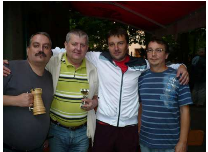
Stupně vítězů 94. turnaje BudChess série