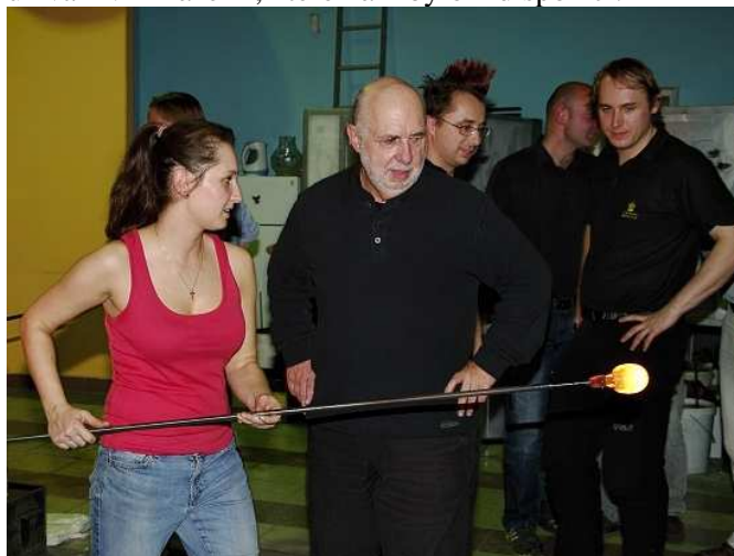
Šachoví velmistři na exkurzi v novoborské sklárně