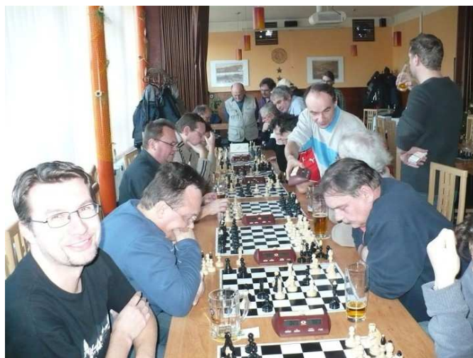
Uvolněná atmosféra loňského turnaje

V nedávno uplynulých dnech se podařilo úspěšně uzavřít složitá jednání, takže můžeme oficiálně oznámit, že závěrečný turnaj 7.ročníku BudChess série se bude opět konat ve Ždánicích v hotelu Radlovec, a to v neděli 26.prosince 2010 od 13 hodin. Turnaj je vypsán jako otevřený a pořadatelsky je plně v gesci ždánického šachového klubu. Jak víte z minulých ročníků, jedná se o společenskou událost mimořádné úrovně, takže je to pro většinu hráčů skvostná příležitost pozvat na turnaj i své životní partnerky, které tak na vlastní oči uvidí, jak se ti jejich chlapi umí bavit.