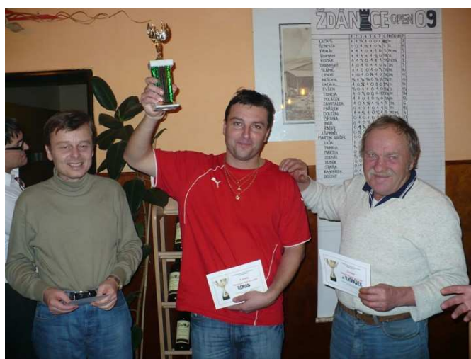
Medailisté Štěpánského turnaje 2009 ve Ždánicích: