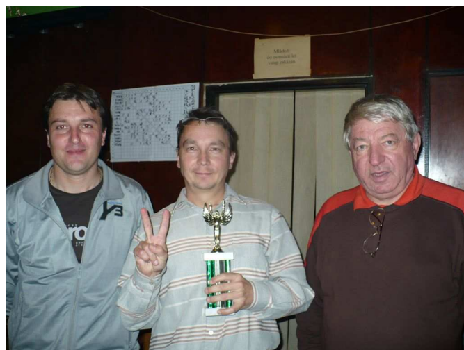
Stupně vítězů 85. turnaje Budchess série