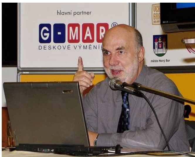
Velmistr Lubomír Kaválek při přednášce