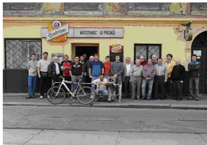
Foto před jubilejním 100. turnajem U Pásků

Jelikož BudChess série se zrodila o téměř 5 let později, uspořádali jsme dosud (včetně květnového dosud nesehraného turnaje) o 56 turnajů méně. Nyní máme příležitost této mezeru zmenšit, ale o moc se nám to asi nepodaří, protože věříme, že dlouholetým zkušeným organizátorům šachových turnajů se podaří v brzké době najít jiné místo, kde naváží na přerušovanou tradici.