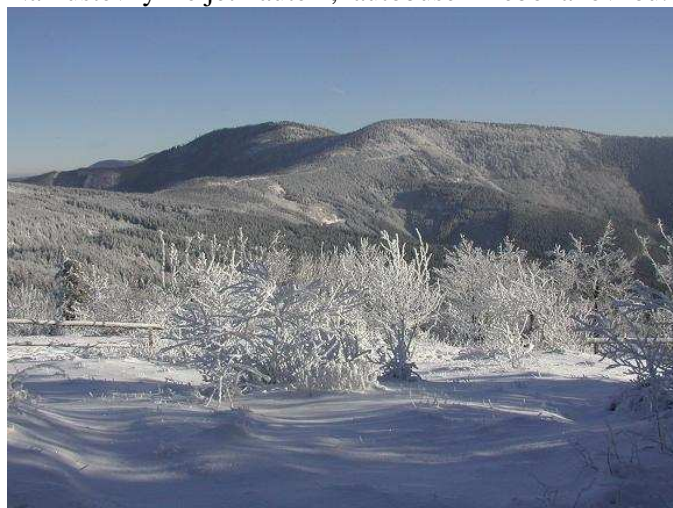
Vpravo vrchol Čertův mlýn 1205m, za ním vlevo Kněhyně 1257m, na hřebenu vlevo před nimi v horském sedle jsou známé Pustevny

8 km. Výškové převýšení je ale velké. Z tábora se sejde do Prostřední Bečvy a od tud po zelené směř Pustevny. Na Pustevny lze jet i autem, autobusem nebo lanovkou.